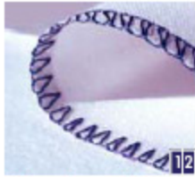
2-draads gerolde overlock breed en smal Werk de rand af voordat u stoffen met een normale rechte steek aan elkaar naait.