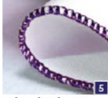
2-draads rolzoom Afwerking van de rand van dunne stoffen. Mooie afwerking op zijde-achtige sjaals, ruches en setvetten.