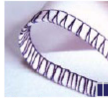
2-draads gerolde overlock, breed en smal Mooie afwerking voor dunne of wollen stoffen.