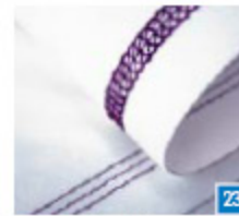
Deksteek drievoudig Voor naden in elastische stoffen en voor decoratieve effecten op alle soorten stoffen. Gebruik decoratief garen in de grijper voor versieringen.