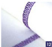
3-draads flatlock, breed Voor het aan elkaar naaien van elastische stoffen met een decoratief effect, met de flatlock-kant of de laddersteek-kant.