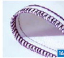
4-draads veiligheidssteek, smal Om stoffen in één stap aan elkaar te naaien met een verstevigde steek en af te werken.