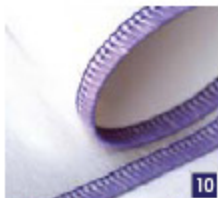
3-draads elastische overlock Voor het naaien van extra elastische dunne of normale stoffen. (Voeg extra elasticiteit toe door een rekbaar garen te gebruiken in de grijpers.)