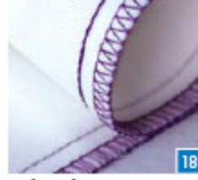
5-draads veiligheidssteek, smal Een duidelijke kettingsteeknaad met overlockrand die in één stap wordt genaaid, voor het naaien van kleding, patchwork en andere projecten.