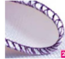
3-draads omgeslagen overlock, smal Perfect voor het afwerken van rokjes of als golftrand op dunne stoffen.