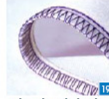
5-draads veiligheidssteek, breed Een duidelijke kettingsteeknaad met overlockrand die in één stap wordt genaaid, voor het naaien van kleding, patchwork en andere projecten.