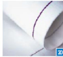
Kettingsteek Voor alle soorten naaiwerk, zoals aan elkaar naaien, zomen en patchwork. Gebruik decoratief garen in de grijper voor versieringen.