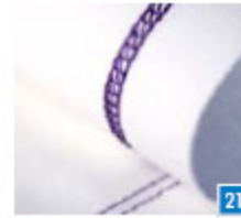
Deksteek smal Voor naden in elastische stoffen en voor decoratieve effecten op alle soorten stoffen. Gebruik decoratief garen in de grijper voor versieringen.