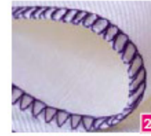
3-draads omgeslagen overlock breed Perfect voor het afwerken van rokjes of als golftrand op dunne stoffen.