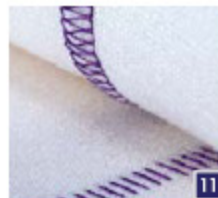
3-draads flatlock, smal Naai elastische stoffen aan elkaar met een decoratief effect, met de flatlock-kant of de laddersteek-kant.