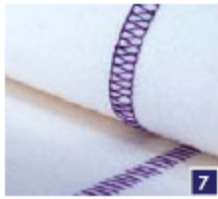
2-draads flatlock, breed Naai elastische stoffen aan elkaar met decoratief effect of werk randen van normale stoffen af.