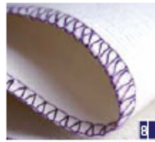
3-draads gerolde overlock, breed en smal Naai, werk de rand af en snijd overtollige stof af in één stap.