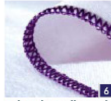
2-draads smalle rand Afwerking van de rand, voor dunne en normale geweven stoffen en dunne gebreide stoffen.