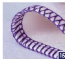
4-draads overlock Naai, werk de rand af en snijd overtollige stof af in één stap. Voor alle naden die elastisch moeten zijn of moeten meetekken, zoals halstanden, zijnaden, mouwen.