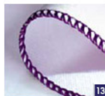
3-draads rolzoom Professionele afwerking op zijde-achtige sjaals, ruches en setvetten.