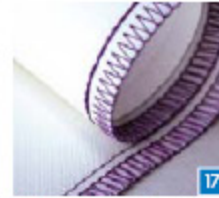
4-draads veiligheidssteek, breed Om stoffen in één stap aan elkaar te naaien met een verstevigde steek en af te werken.