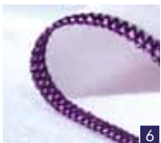
2-draads smalle rand

Afwerking van de rand van dunne stoffen. Mooie afwerking op zijde-achtige sjaals, ruches en servetten.