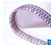
5-draads veiligheidssteek, breed

Een duurzame kettingsteeknaad met overlockrand die in één stap wordt genaaid, voor het naaien van kleding, patchwork en andere projecten.