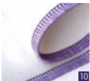
3-draads elastische overlock

Naai, werk de rand af en snijd overtollige stof af in één stap.