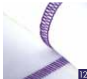
3-draads flatlock, breed

Naai elastische stoffen aan elkaar met een decoratief effect, met de flatlock-kant of de laddersteek-kant.