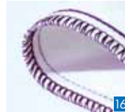
4-draads veiligheidssteek, smal

Naai, werk de rand af en snijd overtollige stof af in één stap. Voor alle naden die elastisch moeten zijn of moeten meerekken, zoals halsranden, zijnaden, mouwen.