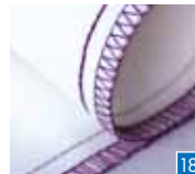
5-draads veiligheidssteek, smal

Perfect voor het afwerken van rokjes of als golfrand op dunne stoffen.