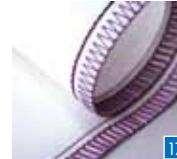
4-draads veiligheidssteek, breed

Om stoffen in één stap aan elkaar te naaien met een verstevigde steek en af te werken.