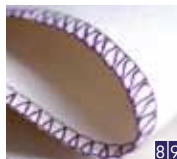
3-draads gerolde overlock, breed en smal

Naai elastische stoffen aan elkaar met decoratief effect of werk randen van normale stoffen af.