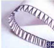
2-draads gerolde overlock, breed en smal

Werk de rand af voordat u stoffen met een normale rechte steek aan elkaar naait.