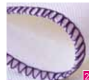
3-draads omgeslagen overlock breed

Een duurzame kettingsteeknaad met overlockrand die in één stap wordt genaaid, voor het naaien van kleding, patchwork en andere projecten.