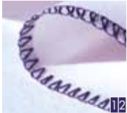
2-draads gerolde overlock breed en smal

Werk de rand af voordat u stoffen met een normale rechte steek aan elkaar naait.