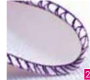
3-draads omgeslagen overlock, smal

Om stoffen in één stap aan elkaar te naaien met een verstevigde steek en af te werken.